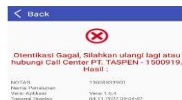
Gambar 10 Otentikasi Gagal.