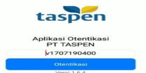
Gambar 4 Memasukkan Notas.