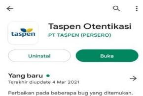
Gambar 2 Install Taspen Otentikasi di Playstore.