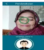
Gambar 8 Proses Otentikasi.