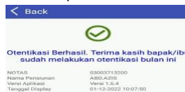
Gambar 9 Otentikasi Berhasil.