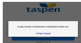
Gambar 7 Pemberitahuan sudah otentikasi.