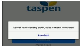
Gambar 6 Server sibuk.