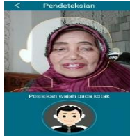
Gambar 5 Pendeteksian Wajah.