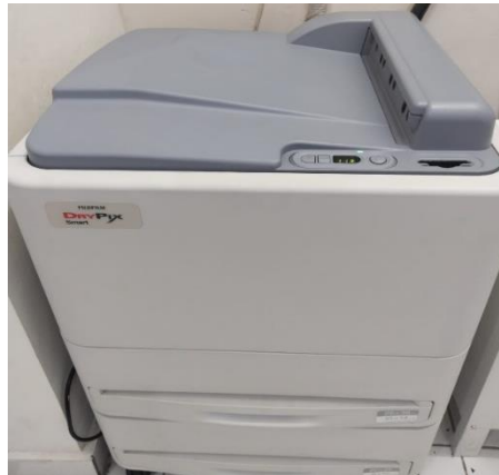
Gambar 5. Printer Filem