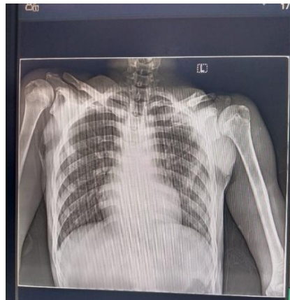
Gambar 7. Radiograf Fraktur 1/3 tengah os clavicula sinistra