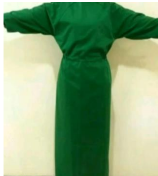
Gambar 6. baju ganti pasien

Sebelum dilakukan pemeriksaan petugas melakukan identifikasi pasien terlebih dahulu antar lain: