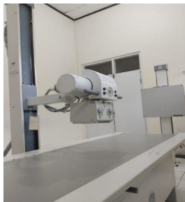
Gambar 2. Pesawat sinar X