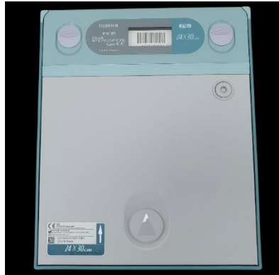
Gambar 4. Kaset ukuran 35 x 43 cm