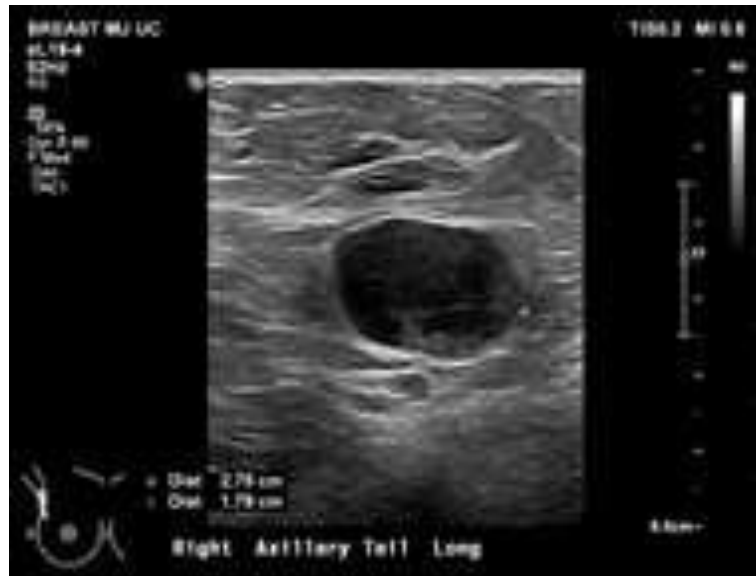
Gambaran 5 : Pembesaran kelenjar getah bening aksila kanan dengan hilangnya hilum lemak. Biopsi dianjurkan. 17

Proliferasi limfosit yang tidak normal dapat disebabkan oleh peradangan, infeksi, atau keganasan, sehingga dokter harus melakukan anamnesis dan pemeriksaan fisik yang terperinci untuk mendeteksi limfadenopati. Saat memeriksa limfadenopati, seseorang harus memeriksa dengan cermat semua daerah anatomi yang relevan, termasuk daerah leher, supraklavikula, aksila, dan inguinal. 14