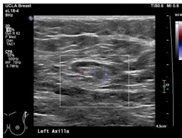
Gambaran 4 : Ultrasonografi menunjukkan kelenjar getah bening aksila kiri jinak dengan ketebalan kortikal kurang dari 3 mm dan hilum lemak yang terjaga. 16

Sistem limfatik merupakan komponen kompleks dari sistem imun yang terlibat dalam penyaringan zat-zat dalam tubuh. Limfosit merupakan agen integral yang terlibat dalam pencarian protein target dan bergerak melalui kelenjar getah bening, yang tersebar di seluruh tubuh. Limfadenopati merupakan istilah yang merujuk pada pembengkakan kelenjar getah bening. Kelenjar getah bening merupakan kelenjar kecil yang bertanggung jawab untuk menyaring cairan dari sistem limfatik. Kelenjar ini terbagi menjadi beberapa bagian yang dikenal sebagai folikel, yang dibagi lagi menjadi zona B dan zona T, yang merupakan lokasi dasar pematangan limfosit. 14