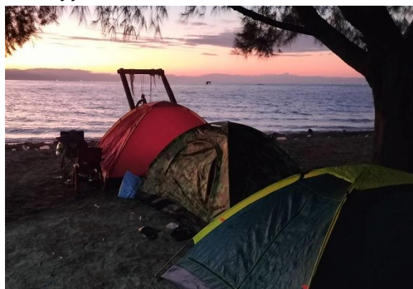
Gambar 3. Aktivitas Wisata di Pantai Kayu Angin

Gambar 3 menggambarkan berbagai aktivitas wisata yang dapat dilakukan di Pantai Kayu Angin, termasuk area camping ground dan zona pasang surut yang cocok untuk berenang dan bermain. Di bagian camping ground, pengunjung dapat menikmati suasana alam yang asri sambil berkemah, yang menjadi pilihan populer bagi keluarga dan kelompok yang ingin merasakan pengalaman berinteraksi dengan alam secara lebih dekat. Sementara itu, kawasan pasang surut yang terlihat di gambar menunjukkan tempat yang ideal untuk berenang dan bermain air, di mana pengunjung dapat menikmati keindahan laut dan beraktivitas dengan aman. Keberadaan fasilitas ini mendukung pemanfaatan potensi wisata pantai secara optimal, meningkatkan daya tarik bagi wisatawan yang mencari rekreasi dan relaksasi. Dengan demikian, Pantai Kayu Angin tidak hanya menawarkan pemandangan yang indah, tetapi juga berbagai aktivitas yang dapat memuaskan kebutuhan rekreasi pengunjung. Dengan beragam aktivitas wisata yang ditawarkan, penting bagi pengunjung Pantai Kayu Angin untuk tidak hanya menikmati keindahan alam, tetapi juga berpartisipasi aktif dalam menjaga kelestarian lingkungan melalui edukasi dan promosi yang lebih intensif tentang pariwisata berkelanjutan.