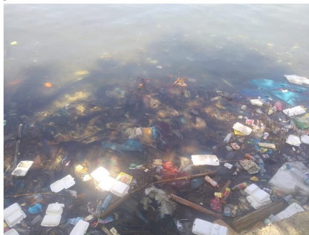
Gambar 2. Bekas sampah yang berasal dari bungkus makanan Wisatawan/ Pengunjung

Namun, partisipasi wisatawan secara keseluruhan dalam mendukung pariwisata berkelanjutan di Pantai Kayu Angin masih perlu ditingkatkan, terutama di kalangan yang memiliki pengetahuan terbatas. Banyak pengunjung hanya datang untuk menikmati keindahan alam tanpa terlibat dalam upaya menjaga kebersihan atau konservasi pantai. "Pantainya indah, tapi pengelolaan sampah harus lebih baik," ujar salah satu responden yang tidak terlibat langsung dalam kegiatan konservasi. Hal ini sejalan dengan temuan (Junaid et al., 2022; Risang Aji, 2023), yang menyatakan bahwa kurangnya edukasi pariwisata berkelanjutan dapat mengurangi keterlibatan wisatawan dalam praktik pelestarian. Oleh karena itu, diperlukan edukasi dan promosi yang lebih intensif dari pihak pengelola dan pemerintah agar wisatawan lebih sadar dan terlibat dalam mendukung pariwisata berkelanjutan di Pantai Kayu Angin. Diperlukan pengelolaan sampah yang lebih baik untuk meminimalisir seperti gambar 2 berikut: