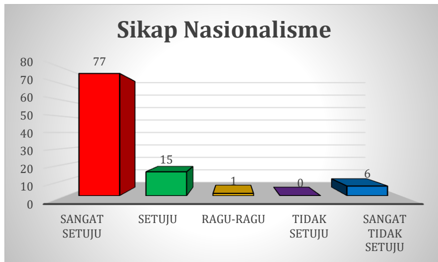
Gambar 2. Histogram Sikap Nasionalisme

Berdasarkan hasil penelitian pada tabel 1 diketahui bahwa level aktivitas fisik peserta didik di perbatasan menunjukkan kategori sedang dengan besar persentase 54%. Merujuk pada pernyataan WHO 2020, sebagian besar bukti menunjukkan bahwa baik anak-anak yang tinggal di perbatasan, nyatanya dunia digital menaklukkan keduanya dan menawarkan kesempatan yang lebih sedikit untuk beraktifitas fisik.