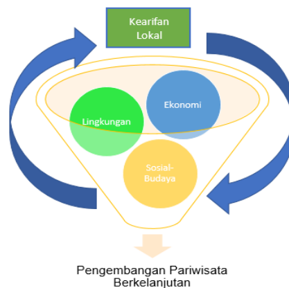
Gambar 1. Konsep Pariwisata Berkelanjutan Berbasis Kearifan Lokal

Dengan menggabungkan aspek ekonomi, lingkungan, dan sosial budaya dalam pengembangan pariwisata, serta menjunjung tinggi kearifan lokal, pariwisata berkelanjutan dapat berfungsi sebagai sarana untuk memperkaya pengalaman wisatawan, meningkatkan kesejahteraan masyarakat, dan menjaga kelestarian budaya serta alam. Upaya ini penting agar pariwisata tidak hanya memberikan manfaat jangka pendek, tetapi juga berkelanjutan dalam jangka panjang.