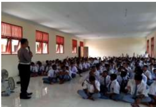
Gambar 1. Penyuluhan Terkait Keselamatan Berlalu Lintas

Pernyataan tersebut sejalan dengan temuan Lamdron pada tahun 1982. Faktor penting yang perlu diperhatikan adalah keterlibatan manusia sebagai pengguna jalan, serta kepatuhan terhadap aturan dan kesadaran hukum setiap individu yang menggunakan jalan, baik pengemudi maupun pengguna jalan pada umumnya. Meskipun demikian, masih banyak yang tidak menjunjung hukum dan peraturan yang telah ditetapkan. Menurut Lamdron Nanin, "Tingkat kesadaran hukum pengguna jalan dapat diukur berdasarkan kemampuan dan pemahaman pribadinya, dan juga penerapannya di jalan."