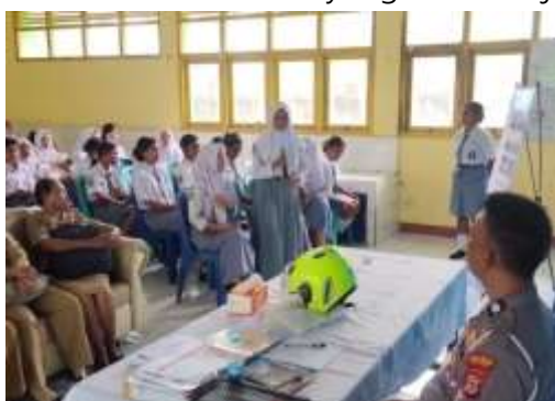
Gambar 2. Diskusi dan Tanya Jawab antara Petugas dan Siswa

Kegiatan ini akan dilakukan melalui empat metode utama dalam penyampaian materi: presentasi video, ceramah, diskusi, dan latihan praktik lapangan. Dampak dari kegiatan ini adalah peningkatan pengetahuan peserta mengenai peraturan lalu lintas, sehingga meningkatkan kesadaran mereka dalam berkendara yang benar di jalan raya.