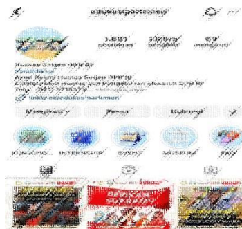
Gambar 2. Tampilan Instagram E P