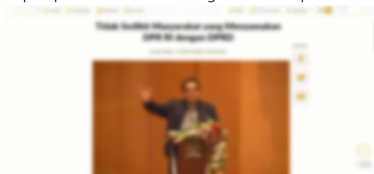
Gambar 1. Ketidaktahuan Masyarakat

Kurangnya pemahaman masyarakat Indonesia tentang tugas & kewenangan parlemen menjadi tantangan penting yang harus diatasi untuk memperkuat demokrasi dan partisipasi publik di Indonesia. Banyak masyarakat yang memiliki pemahaman yang terbatas atau bahkan salah tentang tugas & kewenangan parlemen. Salah satu konsekuensi utama dari minimnya pengetahuan masyarakat tentang parlemen adalah rendahnya tingkat partisipasi politik. Ketika masyarakat tidak memahami tugas & kewenangan parlemen dalam proses politik, masyarakat cenderung merasa tidak terkoneksi dengan keputusan yang diambil oleh lembaga tersebut. Ini mengakibatkan rasa skeptisisme terhadap sistem politik. Masyarakat menilai parlemen secara negatif karena informasi yang disajikan oleh media saat ini, serta kurangnya pemahaman tentang kinerja parlemen menyebabkan cenderung skeptis terhadap politik dan demokrasi di Indonesia, minat terhadap kegiatan yang berhubungan dengan politikpun menurun, dan kurangnya dukungan untuk partisipasi publik membuat kurang memahami politik.