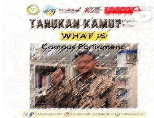
Gambar 4. Program Konten Tahukah Kamu