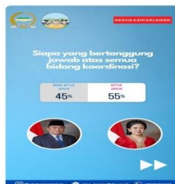
Gambar 6. Program Konten Ujian Selasa (USA)