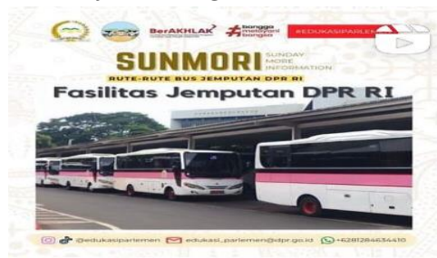
Gambar 5. Program Konten Sunmori