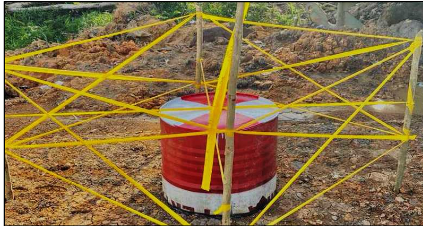
Gambar 2. Ground Control Point (GCP)

Pengukuran Ground Control Point (GCP) harus memiliki tanda atau premark yang dapat terlihat pada foto udara. Premark dapat berupa tanda silang atau lingkaran serta memiliki warna yang mencolok. Pada penelitian ini Ground Control Point (GCP) berbentuk lingkaran dibuat menggunakan drum yang diwarnai merah dan putih membentuk tanda silang.