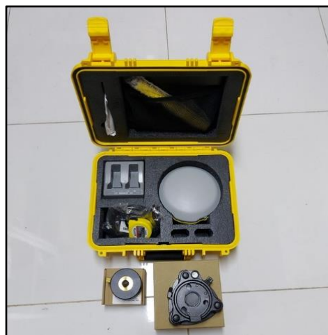
Gambar 1. GPS Geodetik Trimble R8s LT

Pada lokasi penelitian dilakukan pengukuran GCP sebanyak 4 titik. GCP merupakan titik pengambilan data koordinat yang diukur menggunakan GPS Geodetik Trimble R8s LT. GCP digunakan untuk melakukan pengkoreksian data geometrik untuk melakukan koreksi posisi citra fotogrametri dari wahana Unmanned Aerial Vehicle (UAV) akibat kesalahan konfigurasi sensor, posisi, kecepatan, pengaruh angin, ketinggian wahana.