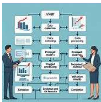
Gambar 1. Flowchart Penelitian

Metode penelitian yang dilakukan pada analisis yaitu: