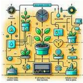
Gambar 1 Diagram Skema smart garden

Proses Agile ini akan diulang beberapa kali hingga sistem selesai dikembangkan.