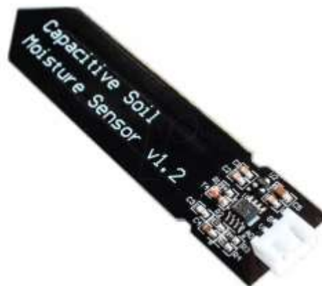
Gambar 5 Sensor Soil Moisture

Sensor yang digunakan salah satunya adalah soil moisture