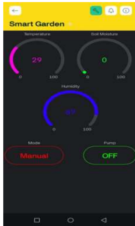
Gambar 4 tampilan IoT

Sensor yang digunakan salah satunya adalah soil moisture