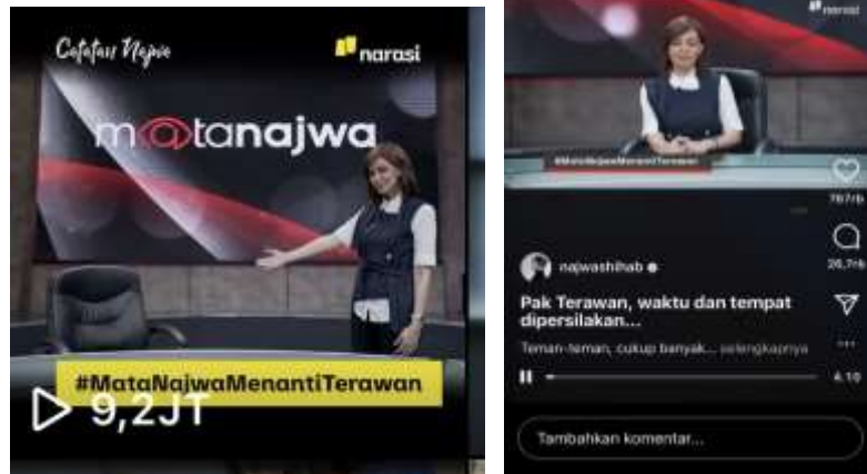
Gambar 2. Data Postingan @Najwashihab Terkait Isu Sosial pada Postingannya tentang Viralnya Menteri Kesehatan yang Takut Penuhi Panggilan Najwashihab ke Acara Matanajwa