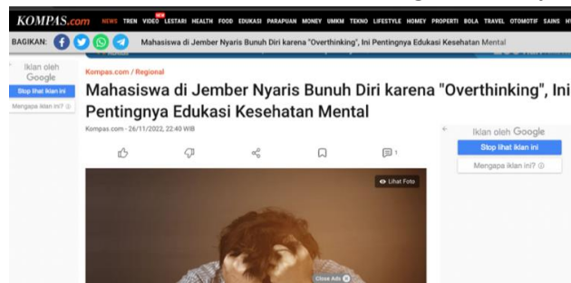
Gambar 3. Berita Mahasiswa Nyaris Bunuh Diri Karna Overthinking

Berdasarkan Tabel 1, Masalah yang ingin tekankan di Bait I adalah Overthinking. (Nuraisah, 2023). Faktor-faktor seperti keluarga, studi, dan pekerjaan sering memicu overthinking, Overthinking berasal dari pemikiran negatif dan irasional sehari-hari. Akibatnya, tindakan overthinking ini cenderung memicu kecemasan, terutama kecemasan terkait dengan masa depan. Menurut (Bahrian, 2022). Overthinking menyebabkan ekspektasi tinggi, kekecewaan, dan berpotensi merusak kesehatan mental dengan risiko yang serius.