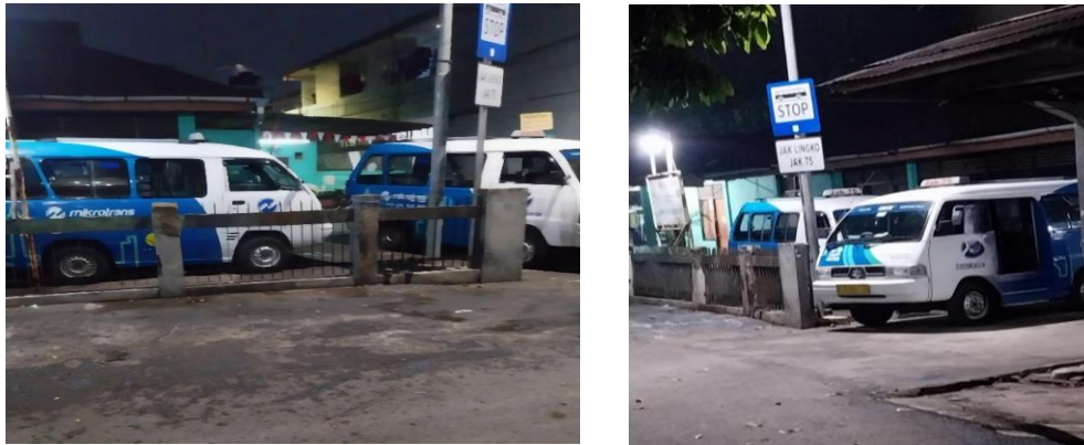
Gambar 2. Pangkalan Jak-Lingko Kampung Pulo Tahun 2023

Berdasarkan hasil wawancara pra-penelitian pada tabel 1 merupakan hasil observasi dan wawancara dilakukan peneliti kepada pengguna Jak-Lingko 75 dan berdasarkan hasil pengamatan serta pengalaman peneliti sebagai pengguna Jak-Lingko 75, dapat disimpulkan untuk mencapai kinerja para pengemudi Jak-Lingko tidak menunjukkan atas motivasi kerja dan disiplin para pengemudi dalam melayani para penumpang. Hasil pengamatan terkait dengan motivasi dan disiplin kerja berdasarkan trip pada Jaklingko 75. Observasi dari tanggal 18 November 2023 s.d 28 November 2023 dapat dilihat pada gambar 2.