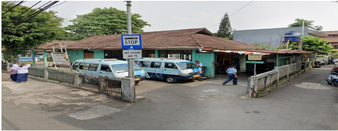
Gambar 1. Pangkalan Jak-Lingko Kampung Pulo Tahun 2023

Sumber: Google Maps. Pool Jak-Lingko 75 Kampung Pulo