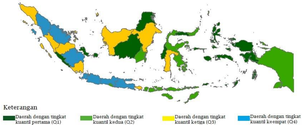
Gambar 2 : Persebaran Konsumsi Rumah Tangga di Indonesia

termasuk kedalam tingkatan ini. Dan pada tingkatan 4 dengan persentase 100 persen terdapat 8 provinsi yang termasuk kedalam tingkatan ini.