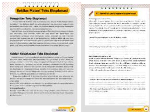
Gambar 3. Materi dan Soal LKPD