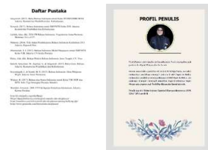
Gambar 4. Bagian akhir LKPD