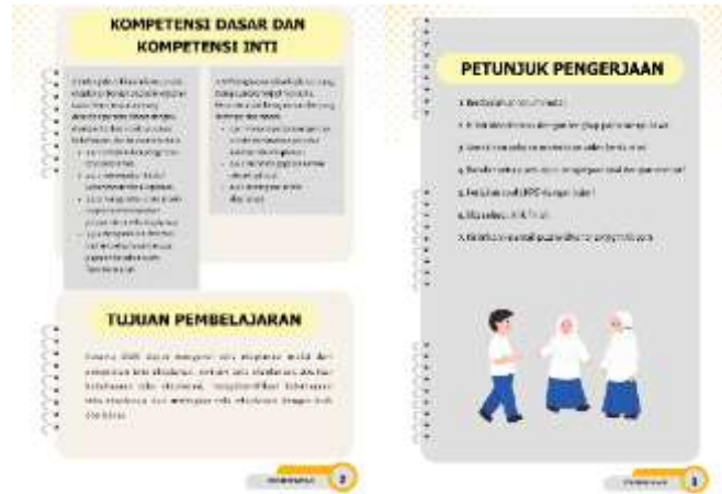
Gambar 2. Bagian isi LKPD