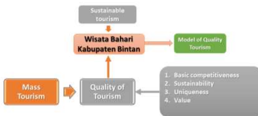
Gambar 1. Framework Penelitian

Penelitian mengenai kualitas pariwisata yang berkaitan dengan wisata bahari di Kabupaten Bintan dilakukan dengan metode kualitatif deskriptif. Dalam pengumpulan data, peneliti melakukan interview kepada stakeholder-stakeholder yang terkait dengan pengelolaan destinasi wisata dan pengambilan kebijakan. Interview dilakukan kepada pengelola destinasi wisata, pihak swasta, Dinas Pariwisata dan Kebudayaan Kabupaten Bintan.