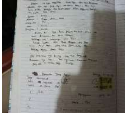
Gambar 4. Surat Pernyataan Tindak Asusila di Taman Tingkir

sosial serta menjaga kenyamanan sesama pengguna taman. Meskipun ada aduan dari masyarakat security tidak serta merta langsung menindak, melainkan melakukan cross check sebelum memberikan tindakan, selama mereka dirasa belum melampaui batas norma dan belum ada kondisi anomi, maka tidak akan ada tindakan (Wawancara Security Taman Tingkir 18 Mei 2024).