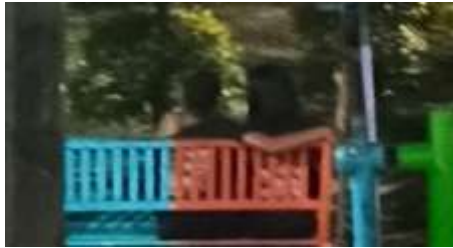
Gambar 1. Taman Kota Salatiga : Bermesraan di Taman Tingkir

melakukan tindak pacaran yang mengarah ke tindak asusila. Penyimpangan yang terjadi di Taman Tingkir menurut beberapa pengguna telah menyalahi norma kesusilaan, melakukan perbuatan yang berkaitan dengan kelamin, atau bagian badan yang membuat rasa malu, jijik atau merangsang birahi orang lain (Data pribadi pra-research 13 April 2024). Masyarakat sekitar menyayangkan perilaku tersebut terjadi Taman Tingkir karena hal tersebut tidak sepatutnya dipertontonkan di tempat umum. Security menindak tegas perihal tersebut, meskipun tidak ada aturan tertulis tetapi norma sosial tetap dijalankan di Taman Tingkir.