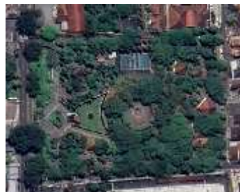
Gambar 3. Foto Taman Tingkir

Taman Tingkir dibangun di atas tanah bengkok seluas \pm 11.000 \text{ m}^2 , tepatnya di Jalan Tritis Sari No.17, Kelurahan Sidorejo Kidul, Kecamatan Tingkir, Kota Salatiga. Pembangunan Taman Tingkir sendiri memakan waktu sekitar 5 bulan yang difungsikan sebagai ruang terbuka hijau (Sekretariat DPRD Kota Salatiga, 2016). Alasan didirikan Taman Tingkir yaitu berdasarkan Program Pengembangan Kota Hijau (P2KH), pembangunan ini bermaksud untuk mengimplementasikan Perda Kota Salatiga No.4 tahun 2011 mengenai Rencana Tata Ruang Wilayah Kota Salatiga dalam penyediaan kebutuhan RTH. Taman Tingkir juga dapat digunakan sebagai tujuan wisata karena banyak tempat bermain bagi anak-anak. Selain itu, Taman Tingkir dapat dijadikan sebagai ruang interaksi secara formal maupun informal bagi masyarakat dan menjadi ruang aktivitas ekonomi bagi pedagang kaki lima. Taman Tingkir juga memiliki beberapa fasilitas seperti toilet umum, mushola, arena olahraga, arena bermain khusus anak-anak, Corner Learning Center , serta fasilitas untuk pengunjung difabel dan lansia. Taman tingkir dikategorikan sebagai ruang terbuka hijau yang didirikan untuk menciptakan keseimbangan antara ruang terbangun dan ruang terbuka hijau di Kota Salatiga (Trivita Widayanti & Suroso Hadi, 2017).