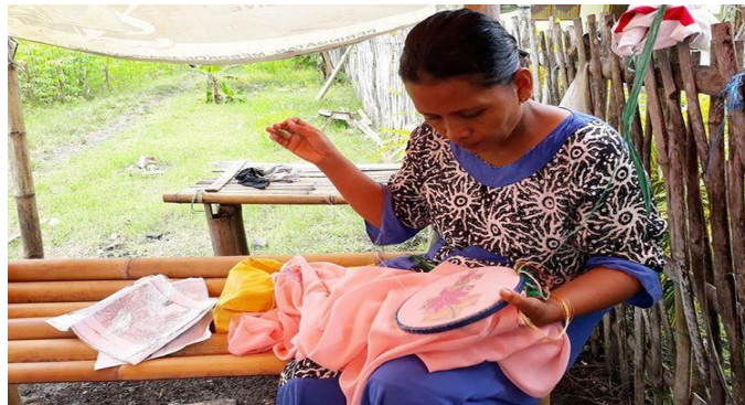
Gambar 4. Wanita yang sedang menjahit kain dengan cara menjepitnya dengan ram atau pembidang untuk membantu menahan posisi kain pada bidang yang akan disulam.

membentuk suatu pola tertentu. Sulaman karawo dapat dijadikan pada berbagai jenis kerajinan seperti sapu tangan, dasi, selendang, kipas, dan kain. Selain kerajinan tersebut, barang yang paling populer di Gorontalo adalah baju karawo untuk pria dan wanita. Anda bisa dengan bebas menyesuaikan desain bordir karawo yang indah. Sulaman karawo yang dibanggakan oleh masyarakat Gorontalo telah menyebar dalam berbagai bentuk. Salah satu upaya pemerintah untuk memasyarakatkan sulaman karawo adalah dengan mengadakan festival budaya karawo besar-besaran setiap tahun dengan biaya yang tidak sedikit (Dai, 2018: 5).