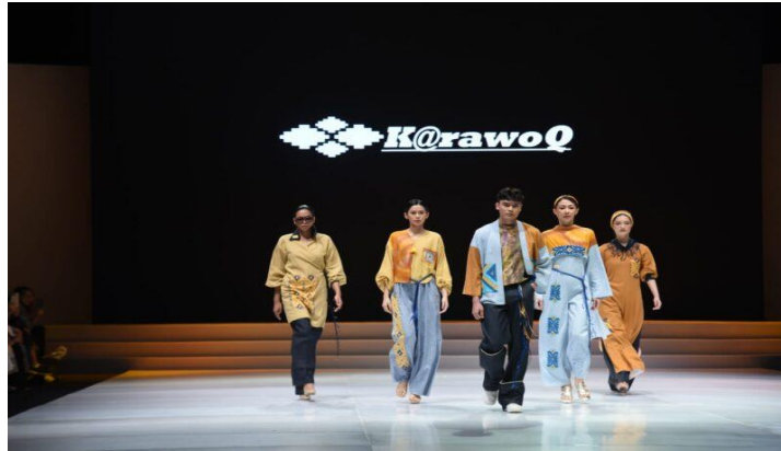
Gambar 5. Remaja, desainer dan pengrajin Karawo ikut serta di IFW 2023

Tapa di daerah Gorontalo oleh para wanita yang terbuat dari kain yang digunakan untuk sapatangan, seratnya dipotong sembilan dan benang yang diperlukan untuk membuat hiasan dipintal dari kapas.