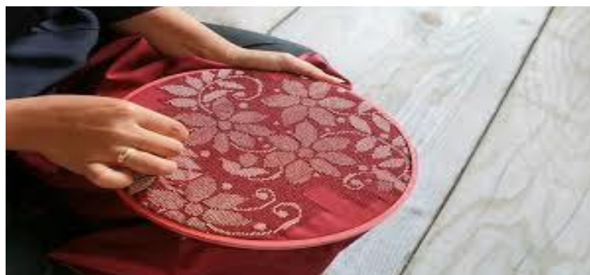
Gambar 3. Proses pengerjaan sulaman karawo yang sangat memerlukan ketelitian serta ketekunan luar biasa untuk membuatnya.

Kain sulaman karawo tersebut tidak hanya menggunakan kain sulaman biasa, tetapi tingkat kesulitan pengerjaan sulaman karawo sangat tinggi dengan membutuhkan waktu dan ketelitian, keteguhan yang luar biasa. Contohnya, satu sulaman Karawo yang berukuran hanya 20cm x 20cm memerlukan waktu sebulan untuk menyelesaikannya. Dibutuhkan tiga orang dengan peran berbeda untuk mengerjakan desain bordir karawo. Karawo sudah hidup bertahun-tahun tanpa pengembangan besar, dengan menggunakan motif sederhana, dengan jenis kainnya yang terbatas dan penggunaan apa saja. Kain Sulaman ini juga masih tetap terjaga dan bertahan karena tetap memiliki fungsi sosial yang dibutuhkan oleh masyarakat. Kegiatan sosial ini kemudian diambil alih dan disebar ke daerah lain di sekitar desa Ayula.