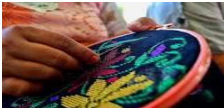
Gambar 1. Wanita yang sedang menghiasi kain dengan cara menyulam dengan menggunakan peralatan dan bahan seperti jarum jahit, jarum sulam dan benang.

Metode Sulaman Karawo yaitu serat kain yang sudah jadi dipotong dan dilucuti benangnya, dengan kemudian disulam tangan dengan jarum menggunakan benang yang berbeda sesuai pola atau motif desain yang dibutuhkan oleh pengrajin. Sulaman karawo dapat dikerjakan dengan pada berbagai macam jenis kain. Sangat sulit mengerjakan dengan menggunakan kain sutera Karawo yang sangat membutuhkan banyak persiapan hingga tiga bulan. Maka tidak heran lagi jika karawo yang terbuat dari kain sutera tersebut dengan harga yang sangat fantastik. Toko kerajinan (karawo dan souvenir), nama/merk perusahaan "Inn C (Inn Collection)", jenis sulaman tangan (Sulam Karawo), khas Gorontalo (Raffin Hinelo, 2008). Kelompok Usaha Sulaman Karawo, Kabate (Karaowo Batik). Produk yang dihasilkan antara lain aneka pakaian jadi, produk setengah jadi, kerajinan tangan, asesoris pria dan wanita serta bordir karawo. Alat produksi antara lain catok, centimeter, gunting, jarum tangan, pisau cukur, mesin jahit (Hasan, 2017: 5).