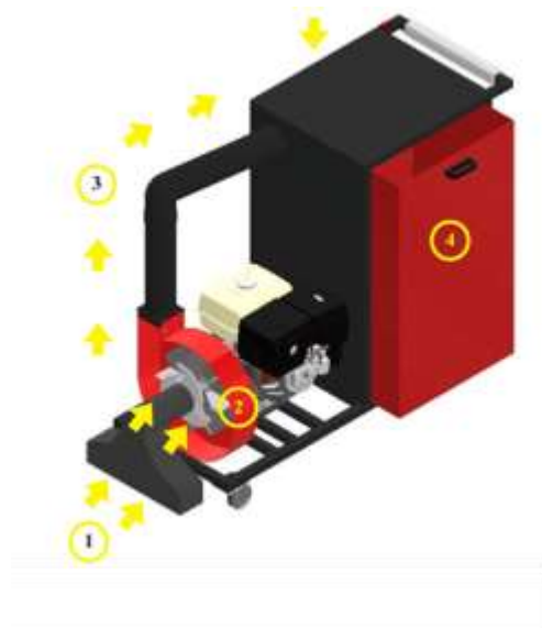
Gambar 2. Alur Proses Leaf Vacuum 2in1

Untuk menyalakan Leaf Vacuum 2in1 diawali dengan menggeser slider pada bagian atas motor engine cover untuk menarik tuas pada bagian motor engine . Setelah tuas ditarik, tekan switch button yang terdapat pada bagian handle ke arah on dan alat akan mulai bekerja. Ketika mesin sudah menyala, petugas kebersihan dapat mendorong Leaf Vacuum 2in1 layaknya mendorong gerobak.