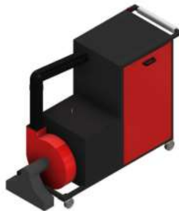
Gambar 1. 3D Design Leaf Vacuum 2in1

Pembuatan 3D Design dilakukan menggunakan software Autodesk Inventor 2023. Gambar 1 merupakan hasil 3D Design Leaf Vacuum 2in1.