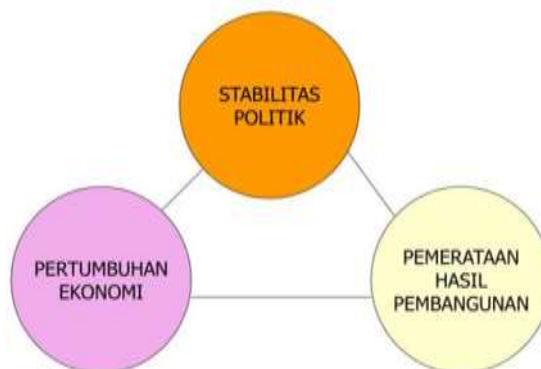
Gambar 2. Trilogi Pembangunan

Situasi ini menunjukkan bahwa sektor pertanian dapat bertahan dan terus memberikan kontribusi terhadap pertumbuhan perekonomian Indonesia di masa depan. Indonesia terdorong oleh kuatnya arus globalisasi untuk terus bangkit dan mengembangkan sektor pertaniannya guna mendorong pertumbuhan ekonomi dan meningkatkan perekonomian negara (Budiandrian et al., 2022). Mempelajari strategi pembangunan dalam konteks globalisasi sangatlah penting. Strategi pembangunan di masa lalu terkonsentrasi pada kesetaraan dan stabilitas, atau Trilogi Pembangunan (Gambar 2), yang merupakan konsep yang bagus namun memiliki banyak kesalahan dalam pelaksanaannya.