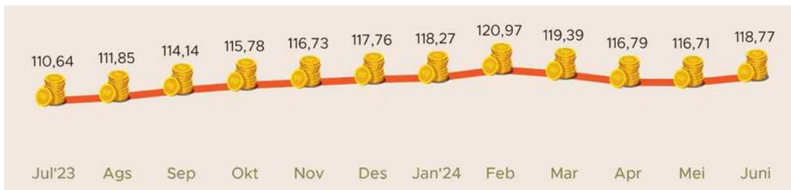
Gambar 1. Nilai Tukar Petani (BPS, 2024)

Sejauh ini, sektor pertanian masih tumbuh positif, sementara pertumbuhan ekonomi secara keseluruhan melambat, namun masih sedikit meningkat (Tono et al., 2023). Ini sejalan dengan Rilis Badan Pusat Statistik (BPS, 2024) terkait Nilai Tukar Petani (NTP), dimana NTP nasional Juni 2024 sebesar 118,77 atau naik 1,77 persen dibanding NTP bulan sebelumnya. Kenaikan NTP disebabkan Indeks Harga yang didapatkan petani (It) naik sebesar 1,85% lebih tinggi dari kenaikan Indeks Harga yang harus dibayar oleh petani (Ib) yang naik sebesar 0,08%.