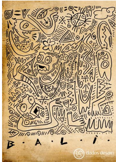
Gambar 2 Ilustrasi primitif karya pageh usianto ((Sumber:

tegas. Kaidah visual yang diungkapkan menggelitik mata hingga rasa penasaran mencari makna-makna baru didalam objek. Garis meliuk bebas bercerita akan keindahan yang tanpa memiliki batas. Penggunaan garis-garis lengkung pada desain t-shirt primitif juga didukung oleh beberapa karya Pageh Usianto yang menggunakan garis lengkung pada karya yang mengangkat konsep primitif, antara lain sebagai berikut.