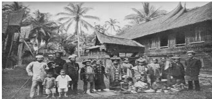
Gambar 3. Kepemimpinan Minangkabau

Fungsi seorang pemimpin di Minangkabau, diantaranya: