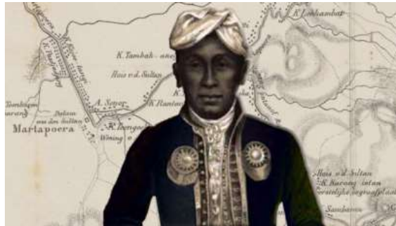
Gambar 2. Foto Pangeran Hidayatullah dengan latar wilayah Kesultanan Banjar. Sumber: kalsel.procal.co .

menguasai sumber daya alam wilayah Kalimantan, ternyata Belanda menginginkan lebih dari itu. Belanda juga ikut mencampuri urusan Kesultanan Banjar yang membuat situasi kerajaan bertambah kacau. Intensitas gesekan yang semakin meningkat antara Belanda dan Kesultanan Banjar menimbulkan banyak permasalahan hingga akhirnya memuncak ke dalam bentuk perlawanan lewat Perang Banjar. Perang Banjar dipimpin oleh Pangeran Antasari dan dibantu oleh Pangeran Hidayatullah II sebagai Mangkubumi (Zulfa, 2014).