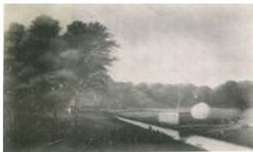
Gambar 3. Lukisan menjelang penyerangan pasukan Belanda ke benteng Ramonia yang dipertahankan Tumenggung Jalil. Idwar Saleh, 1982.

Tumenggung Jalil kemudian membuat benteng di Batu Mandi dan dari benteng ini dapat memutuskan hubungan serdadu Belanda antara Barabai dan Lampihong. Benteng ini terletak di atas sebuah bukit dan di sekitarnya diberi rintangan-rintangan, seperti parit-parit, lubang perangkap, tali jerat dan potongan pohon kayu besar yang sewaktu-waktu dapat digulingkan dari atas bukit. Benteng ini dipercayakan kepada Penghulu Mudin. Ketika serdadu Belanda menyerbu dan menaiki bukit yang dijadikan benteng ini, banyak sekali korban dari pihak Belanda, karena jebak yang dibuat. Diantara yang jatuh korban adalah pimpinan penyerbuan ini Sersan van de Bosch. Karena gagal menaiki benteng tersebut, serdadu Belanda menembaki benteng ini dengan meriam dari bawah. Sementara itu Pangeran Antasari memperkuat benteng Tabalong. Pangeran Antasari menaikkan bendera di atas benteng itu, yaitu bendera merah dengan dua buah keris bersilang.