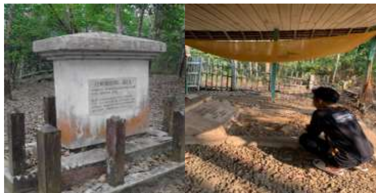
Gambar 4. Tugu Pertempuran di Benteng Tundakan dan Makam Tumenggung Jalil di wilayah Benteng Tundakan.

pelosok, ternyata benteng itu telah kosong. Garis pertahanan Pangeran Antasari antara benteng Pengaron, benteng Tundakan dan Gunung Tongka (di daerah Barito) merupakan basis perjuangan yang tak mudah ditaklukkan Belanda. Tumenggung Jalil setelah terpukul di Banua Lima, kemudian menggabungkan diri ke benteng Tundakan bersama-sama Tumenggung Baro dan Pangeran Maradipa. Ketika terjadi pertempuran menghadapi pasukan serdadu Belanda yang menyerbu benteng Tundakan, banyak korban berjatuhan kedua belah pihak. Benteng di dipertahankan dengan sekuat tenaga oleh para pejuang tak kenal menyerah. Mati syahid adalah idaman mereka dalam setiap pertempuran menghadapi Orang kafir Belanda. Pertempuran itu terjadi pada 24 September 1861. Tumenggung Jalil mempertahankan benteng itu bersama-sama Pangeran Antasari dan tokoh pejuang lainnya. Benteng Tundakan hanya dipertahankan dengan 30 pucuk meriam dan senapan jatuh lebih kecil dibanding dengan persenjataan Belanda. Meskipun dengan persenjataan yang kecil, tetapi dengan semangat juang tak kenal menyerah, akhirnya Belanda terpaksa mundur dan dapat dihalau dari pertempuran.