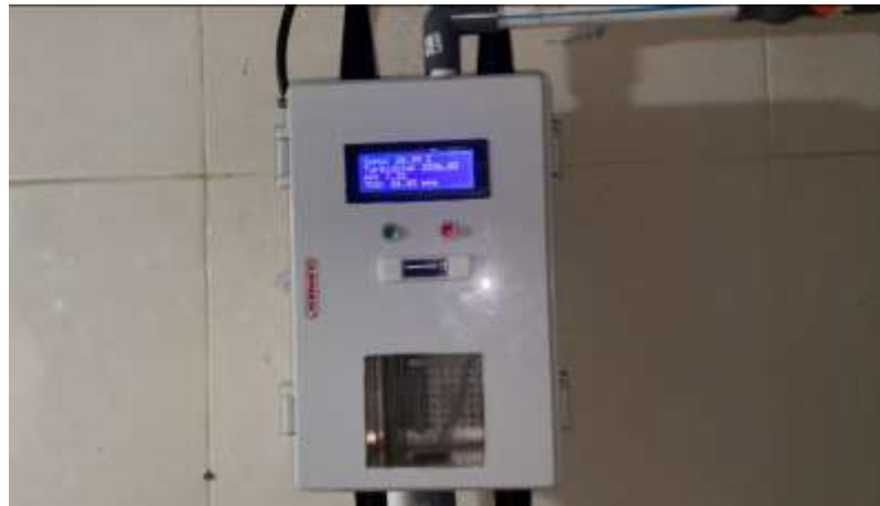
Gambar 4. Pengujian Perangkat Setelah Deployment

Terdapat beberapa fitur pada perangkat seperti LCD 20X4 yang berfungsi menampilkan proses dan hasil sensing , LCD Oled yang berfungsi menampilkan status data sending ke Firebase , relay yang berfungsi mengalirkan arus listrik untuk membuka dan menutup katup solenoid pada pengisian sampel air ke box penampungan, pompa DC yang berfungsi membuang air bekas sampling dan sensor-sensor yang digunakan pada perangkat monitoring kualitas air. Berikut adalah hasil pengujian dari fitur utama pada perangkat monitoring kualitas air v2 :