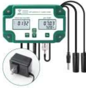
Gambar 3. Alat monitoring pabrikan ke-2

kualitas air yang khusus ditujukan untuk air layak konsumsi yaitu turbiditas.