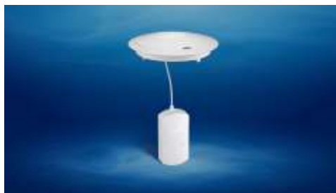
Gambar 2. Alat Monitoring Pabrikan

Pada alat monitoring kualitas air yang beredar dipasaran ada beberapa alat yang merupakan perangkat pabrikan yang menawarkan solusi monitoring air dengan beberapa parameter yang diukur yaitu pH, Alkalinity, dan CYA (Stabilizer) dirancang untuk memantau kualitas air pada kolam renang sehingga tidak memenuhi parameter yang dibutuhkan dalam penentuan kualitas air minum. Sistem pembacaan dalam alat ini menggunakan cartridge dan diganti setiap 90 hari. Data pembacaan sensor dapat dipantau melalui aplikasi mobile. Kekurangan pada alat monitoring pabrikan ini terdapat pada arsitektur perangkat dimana tidak adanya layar yang dapat memonitor hasil pembacaan secara langsung di lapangan dan harga yang relatif tinggi.