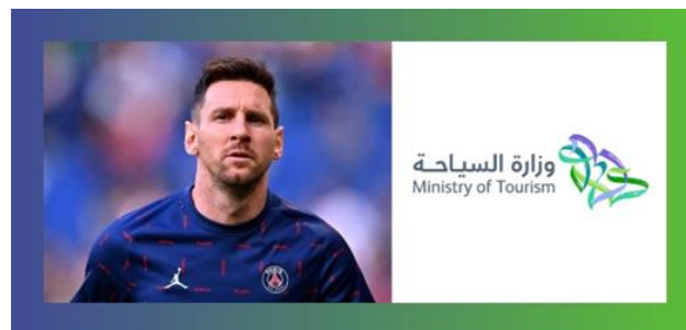
Gambar 3. Lionel Messi menjadi Brand Ambassador Pariwisata Arab Saudi

juga melibatkan implementasi aturan baru. Beberapa aturan tersebut meliputi pembukaan kembali bioskop dengan jumlah yang lebih banyak, pembangunan taman hiburan terbesar, perkembangan industri film, izin penyelenggaraan konser, kebijakan Memperbolehkan pasangan turis dari luar negeri yang belum resmi menikah untuk menginap di hotel. dan penawaran visa turis oleh pemerintah Saudi untuk pertama kalinya, semua bertujuan untuk meningkatkan daya tarik sektor pariwisata (Haryanti, 2019). Dengan diterapkannya kebijakan dan peraturan-peraturan tersebut, pemerintah Arab Saudi aktif mempromosikan sektor pariwisatanya. Keputusan ini cepat mendapatkan perhatian global dan mudah diakses oleh masyarakat digital di era abad ke-21. Oleh karena itu, langkah-langkah yang diambil oleh Arab Saudi untuk memasarkan sektor pariwisatanya dapat dianggap berhasil (Alfarisi, 2022).