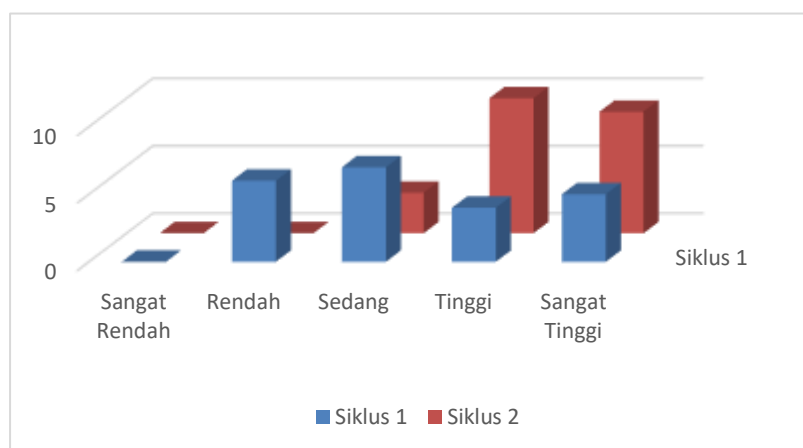
Gambar 3. Diagram batang perbandingan siklus 1 dan 2

Dari Tabel 9 dapat disimpulkan bahwa frekuensi dan persentase nilainya juga meningkat. Siklus 1 memiliki frekuensi (skor sangat rendah 0 peserta didik), (skor rendah 6 peserta didik), (skor sedang 7 peserta didik), (skor tinggi 4 peserta didik) dan (skor sangat tinggi 5 peserta didik). Sedangkan siklus 2 memiliki frekuensi (skor sangat rendah 0 peserta didik), (skor rendah 0 peserta didik), (skor sedang 3 peserta didik), (skor tinggi 10 peserta didik) dan (skor sangat tinggi 9 peserta didik). Untuk mempermudah dalam melihat perbedaan hasil siklus 1 dan siklus 2 maka peneliti membuat diagram batang sebagai berikut.