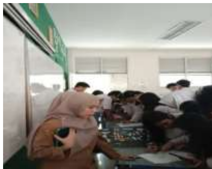
Gambar 1. Hasil Proses Pembuatan Konten Pembelajaran

Berdasarkan hasil observasi peneliti instagram digunakan pada saat pembelajaran berlangsung artinya bisa dilihat bahwa media social instagram digunakan sebagai media pembuatan konten yang dilakukan oleh guru dan siswa di dalam kelas pada saat proses pembelajaran, dengan bantuan peneliti yang memvideokan pada saat pembelajaran berlangsung yang dilakukan sesuai dengan ketentuan dan perintah dari guru yang mengajar dengan pertemuan mata pelajaran yang bersangkutan.