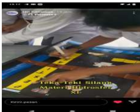
Gambar 2. Hasil Dokumentasi Instagram Media Pembuatan Konten

Setelah selesai memvideokan tersebut di upload di aplikasi instagram dengan memention atau dalam istilah jejaring social Tag dengan menyebutkan nama akun instagram yang tertera pada video yang telah dibuat tersebut.