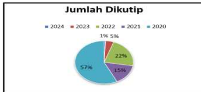
Gambar.1 Persentase Jumlah Dikutip

51 kali mengungkapkan sistem pengendalian internal tidak berpengaruh terhadap pencegahan fraud dalam pengelolaan dana desa. Penelitian ini tidak sejalan dengan penelitian lain dengan variabel sistem pengendalian internal di tahun yang sama yaitu oleh (Adhivinna, Selawati, and Umam 2022) bahwa variabel sistem pengendalian internal berpengaruh positif terhadap pencegahan fraud dalam pengelolaan dana desa.