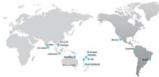
Gambar 1 Wilayah yang Terlibat Penelitian WMP