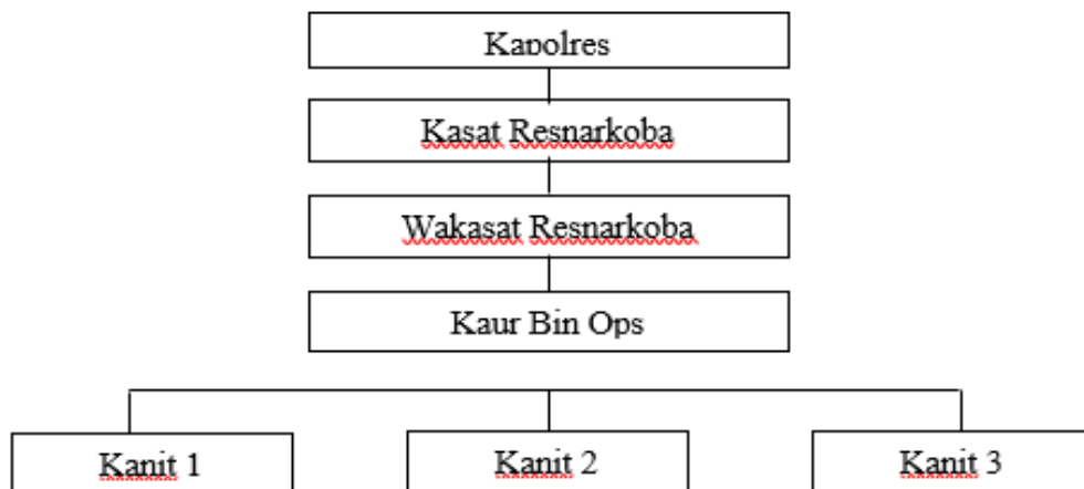
Tabel 1.2 Alur penanganan tindak pidana narkoba Polres Jakarta Utara

Alur penanganan tindak pidana narkoba oleh Satresnarkoba Polres Jakarta Utara merupakan bagian dari tanggung jawab Kapolres. Kapolres memerintahkan Kasat Resnarkoba untuk melakukan penindakan terhadap kejahatan narkoba dan dibantu oleh Wakasat Resnarkoba, Kaur Bin Ops serta jajaran di bawahnya seperti tabel di bawah ini.