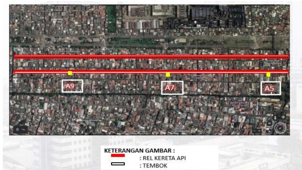
Gambar 1.2 Peta Kampung Muara Bahari

area terluar pemukiman warga dan tidak terindikasi sebagai “sarang narkoba”, sedangkan Kampung Muara Bahari adalah yang selama ini dimaksud sebagai julukan “Kampung Narkoba”. Tanah di mana lokasi Kampung Muara Bahari berdiri sekarang, sampai saat ini masih menjadi perdebatan antara PT Kereta Api Indonesia (KAI) dan masyarakat setempat karena hak kepemilikan yang tidak cukup kuat di antara keduanya.