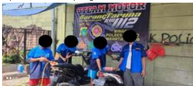
Gambar 1.3 Pemberdayaan pemuda Muara Bahari