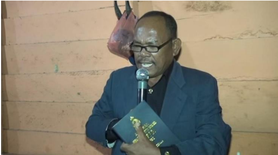
Acara Pengedeng Kuria