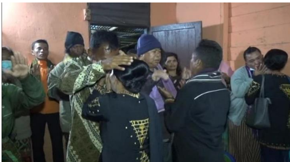
Acara Tumatak I Sapo Tikan Berngin (Acara Tarian Di Dalam Rumah)