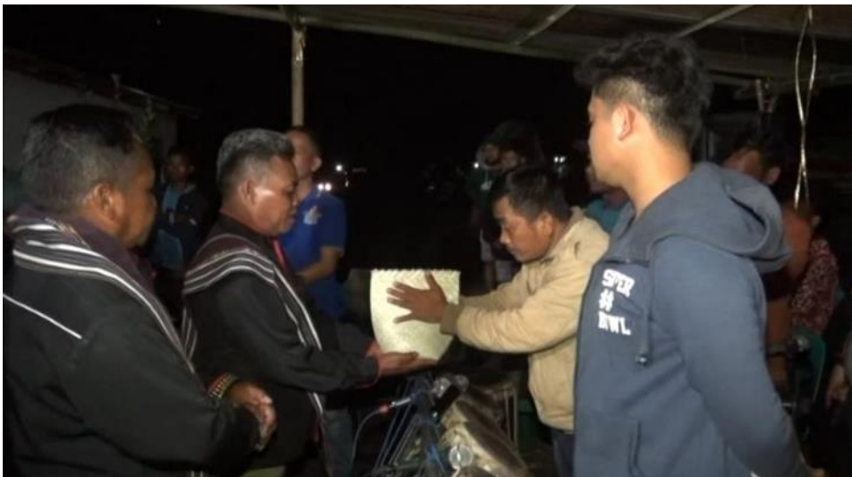
Pesakaten Beras Mpihir Bai Pergenderrang