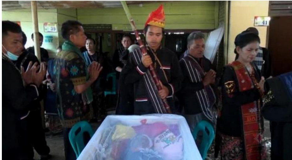
Acara Tatak Tikan I Kasean (Acara Tarian Di halaman Rumah)