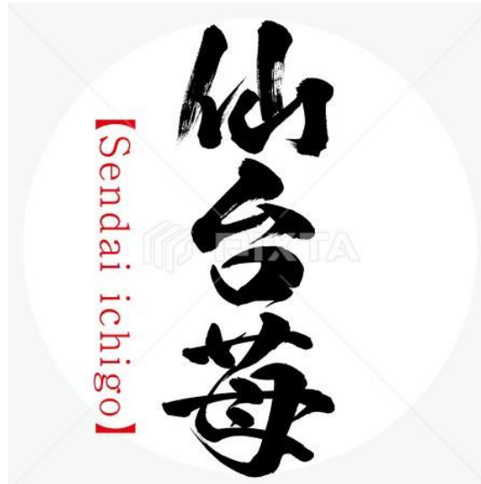
Gambar 1: Merek Kolektif Regional "Sendai Ichigo"

Sistem merek kolektif regional ini diperkenalkan Jepang sebagai upaya pemerintah daerah untuk menstimulasi ekonomi lokal dan memperkuat daya saing industri. Pemerintah Jepang percaya bahwa merek kolektif regional dapat memberikan dampak positif dalam meningkatkan pendapatan UMKM lokal dan berkontribusi terhadap perekonomian negara. Tujuan dari merek kolektif tidak hanya untuk mencegah konsumen dari kebingungan dan bersaing dengan pelaku usaha yang menawarkan barang dan jasa yang sama, tetapi juga untuk mendorong UMKM untuk bekerja sama dan meningkatkan serta menyelamatkan industri tradisional. Seiring berjalannya waktu, industri tradisional dapat hilang dan dilupakan oleh konsumen. Oleh karena itu, keberadaan "Sendai Ichigo" sebagai merek kolektif regional diharapkan mampu mendorong kepedulian industri tradisional dengan meningkatkan keterampilan para pelaku UMKM di daerah tersebut. (L. Port, 2015: 6)