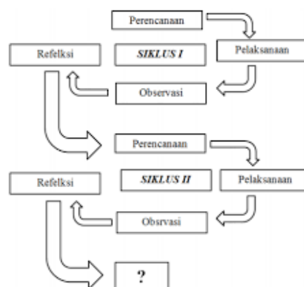
Gambar 1. Langkah PTK (Model Spiral Kemmis & Mc. Taggart)

Penelitian ini merupakan jenis penelitian tindakan kelas (PTK). Penelitian tindakan kelas (PTK) merupakan kegiatan penelitian ilmiah yang dilakukan oleh tenaga pendidik atau guru dengan tujuan untuk meningkatkan mutu atau memperbaiki proses pembelajaran di kelas (Utami, dkk, 2023). Penelitian ini didasarkan pada model spiral yang dikembangkan oleh Kemmis & Mc. Taggart dalam Arikunto (2015). Berikut ini langkah penelitian tindakan kelas (PTK) yang digambar pada skema gambar 1.