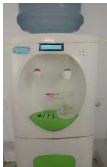
Gambar 2. Tampak depan prototype smart dispenser

Dari gambar 1 di atas, terlihat bahwa ada peningkatan response time seiring dengan bertambahnya jarak antara sensor dan kartu RFID. Pola ini menunjukkan bahwa response time bertambah mendekati garis linera seiring dengan bertambahnya jarak. Semakin jauh jarak antara sensor dan kartu RFID, semakin besar response time yang diperlukan untuk membaca informasi dari kartu RFID. Hal ini dapat disebabkan oleh beberapa faktor, termasuk salah satunya lemahnya sinyal RFID pada jarak yang lebih jauh dan waktu tambahan yang dibutuhkan oleh sistem untuk memproses sinyal yang lebih lemah.