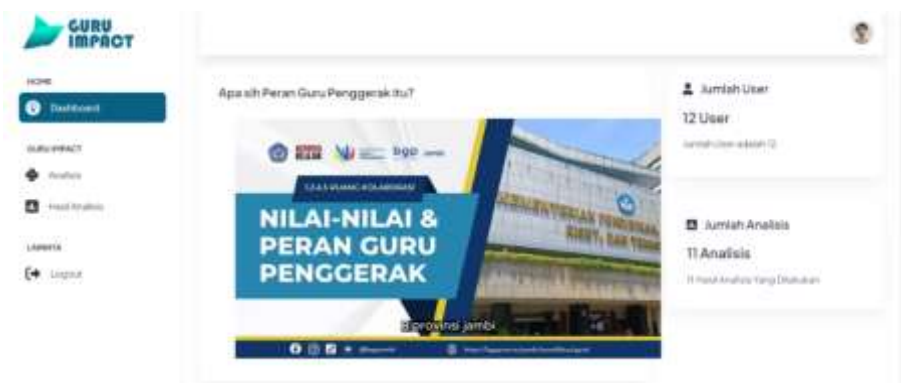
Gambar 5. Halaman Dashboard 1

Pada Gambar 5 dan Gambar 6 merupakan tampilan dashboard yang menampilkan menu analisis, hasil analisis dan informasi penting lainnya.