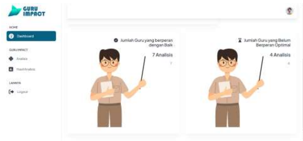
Gambar 6. Halaman Dashboard 2