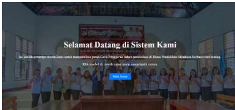
Gambar 3. Halaman Welcome

Pada Gambar 3 adalah Pada Gambar 4.14 merupakan halaman welcome untuk menyambut pengguna sebelum memulai sistem.