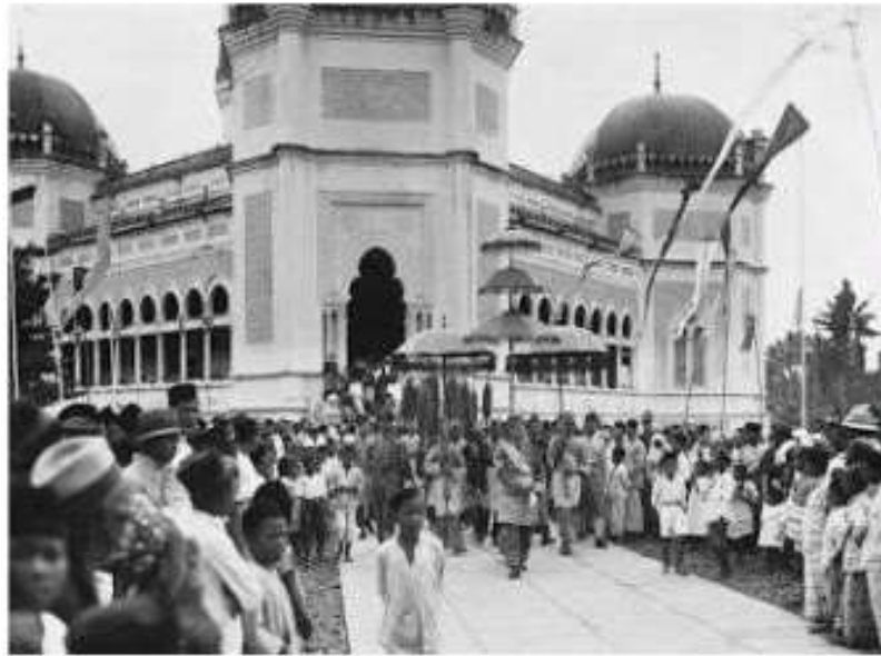
Gambar 2. Amaluddin Sani Perkasa Alam Syah saat meninggalkan Masjid Al-Mashun

Al-Mashun tidak pernah mengalami perubahan karena masjid ini termasuk situs bersejarah yang dilindungi undang-undang.