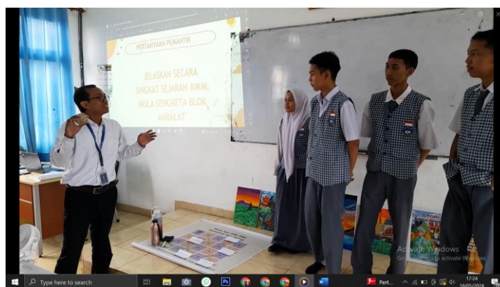
Gambar 3. Guru menjelaskan penggunaan media ular tangga

Dari data yang telah dikumpulkan peneliti kemudian merancang kembali modul ajar dan LKPD sesuai dengan temuan yang ada peserta didik. Yang meliputi gaya belajar dan kebutuhan belajar peserta didik. Kemudian peneliti merumuskan dan memberikan inovasi berupa model pembelajaran Problem Based Learning dengan penggunaan media pembelajaran ular tangga. Pada fase F ini peserta didik mendapatkan materi NKRI dengan sub bab sengketa batas wilayah blok ambalat antara Indonesia dan Malaysia. Dengan materi tersebut peneliti sesuaikan proses belajar dan kebutuhan belajar peserta didik dengan media pembelajaran ular tangga