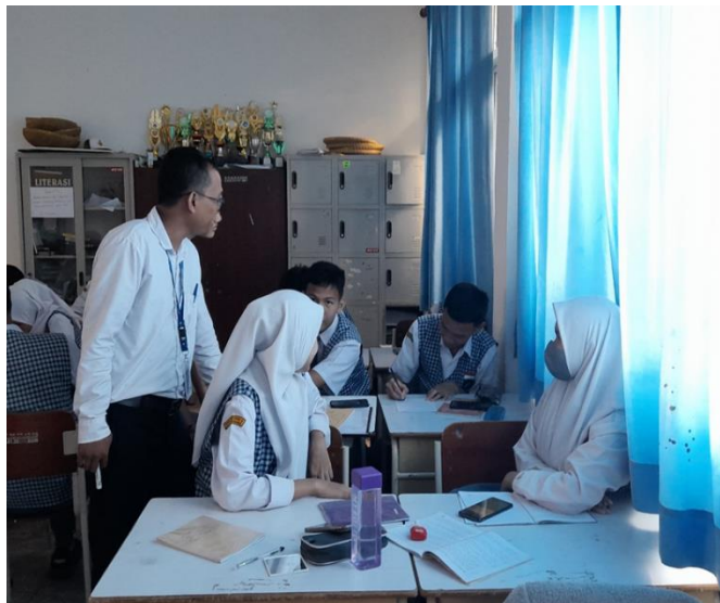
Gambar 2. Peneliti melakukan pengamatan dan observasi peserta didik

Dari data yang telah dikumpulkan peneliti kemudian merancang kembali modul ajar dan LKPD sesuai dengan temuan yang ada peserta didik. Yang meliputi gaya belajar dan kebutuhan belajar peserta didik. Kemudian peneliti merumuskan dan memberikan inovasi berupa model pembelajaran Problem Based Learning dengan penggunaan media pembelajaran ular tangga. Pada fase F ini peserta didik mendapatkan materi NKRI dengan sub bab sengketa batas wilayah blok ambalat antara Indonesia dan Malaysia. Dengan materi tersebut peneliti sesuaikan proses belajar dan kebutuhan belajar peserta didik dengan media pembelajaran ular tangga