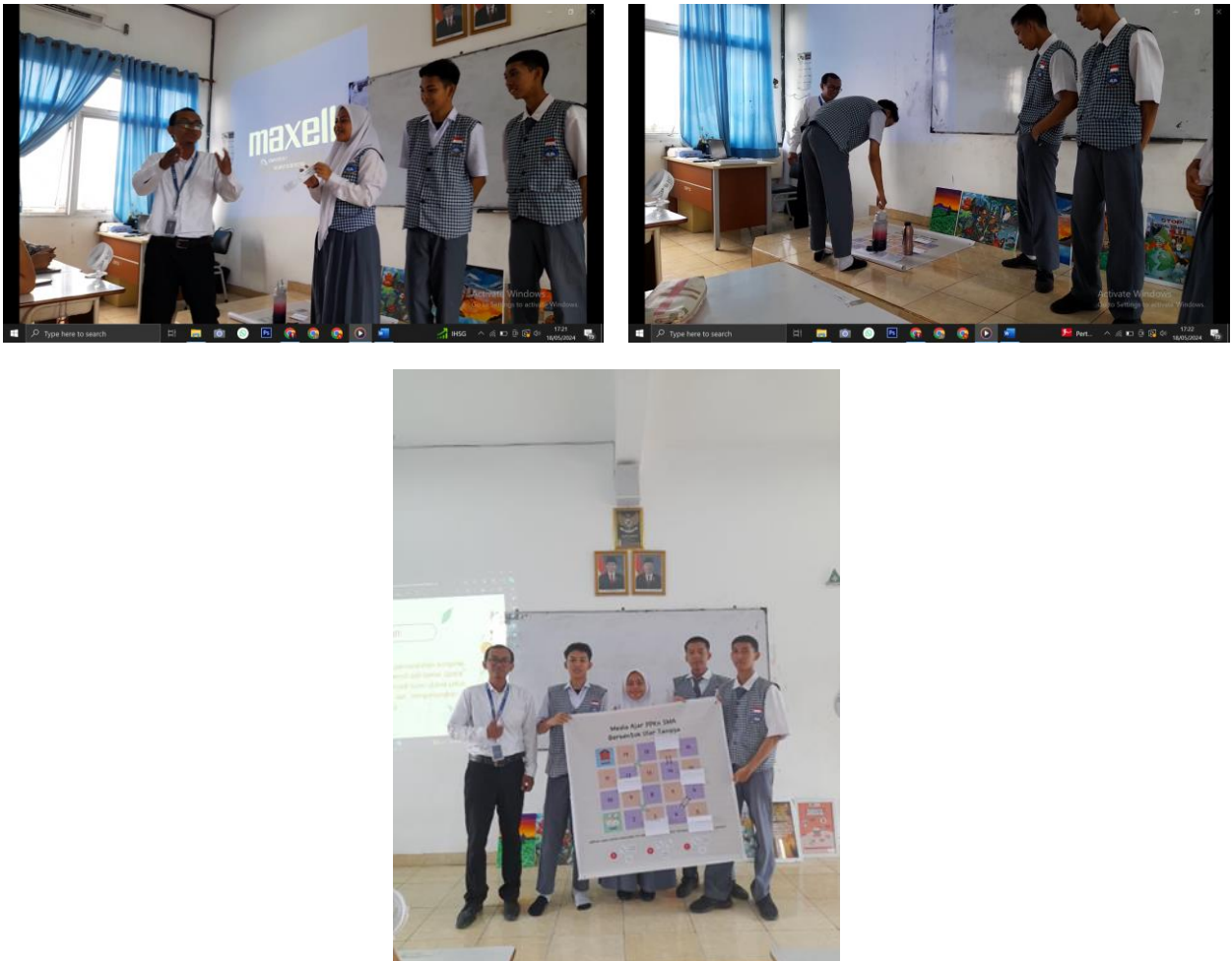
Gambar 4. Proses pelaksanaan pembelajaran dengan media ular tangga

mereka berhenti. Dengan pertanyaan yang memperhatikan materi pembelajaran tentang sengketa blok ambalat dan cara penyelesaiannya dari berbagai sudut pandang. Begitu dan seterusnya sampai pemain mampu menyelesaikan setiap rintangan yang dihadapi pada media pembelajaran ular tangga dan peserta didik yang mencapai angkat terakhir di pastikan sebagai pemenang dalam pembelajaran dengan media ular tangga. Hal ini menunjukkan bahwa dalam penggunaan media pembelajaran ular tangga dalam mata Pelajaran PPKn di kelas XI.8 SMA Negeri 6 Palembang ini mampu meningkatkan keaktifan belajar peserta didik serta sesuai dengan gaya dan kebutuhan belajarnya.