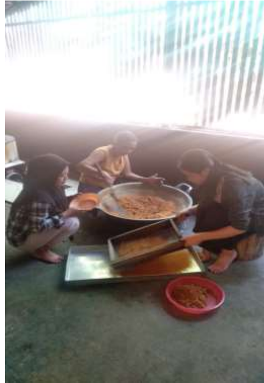
Gambar 6. Praktik pembuatan gula kristal