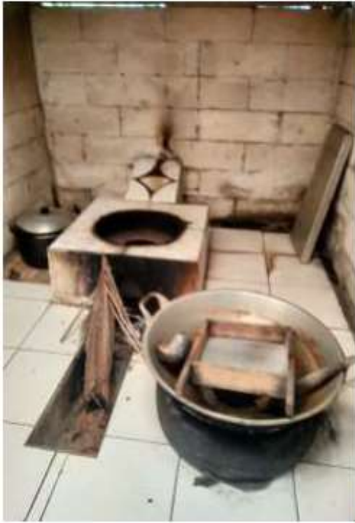
Gambar 5. Alat produksi gula kristal

plastik. Alat-alat ini diadakan untuk membantu para petani dalam proses produksi gula semut dengan standar ekspor (sertifikasi organik).