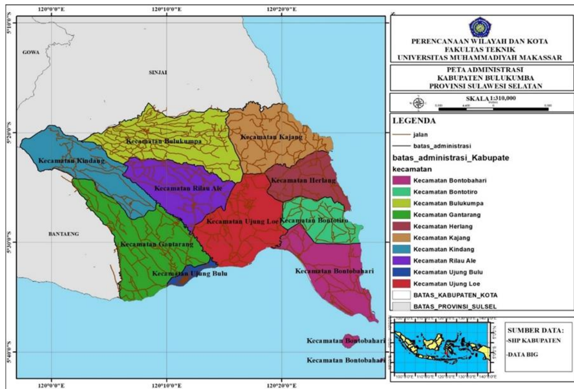
Gambar 1. Peta Lokasi Penelitian Sektor Ekonomi