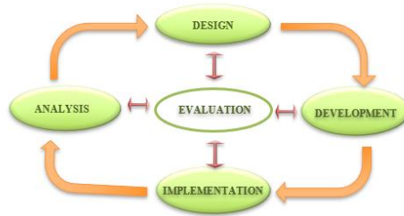
Gambar 1 Model Pendekatan ADDIE

Subjek penelitian ini adalah siswa kelas tinggi di salah satu sekolah dasar di Kabupaten Sumedang. Jumlah subjek yang diperlukan untuk menguji kelayakan produk yang dibuat terdiri dari 70 siswa yang terbagi dalam 10 siswa pada uji coba perorangan, 20 siswa pada uji coba kelompok kecil, dan 40 siswa pada uji coba kelompok besar.