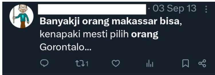
Gambar 6. Netnografi Preferensi Pemilih Makassar