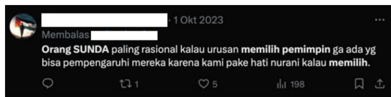
Gambar 3. Netnografi Preferensi Pemilih Sunda

Temuan kami tidak selaras dengan penelitian Haddad (2017) yang menyatakan Etnis Sunda cenderung memilih pemimpin yang bersesuaian dengan etnisitas dan budaya mereka. Namun, penelitian kami selaras dengan Herdiansah dan Albanjari (2023) yang menyatakan etnis Sunda lebih memilih pemimpin berdasarkan nilai ideal kepemimpinan Sunda seperti kecerdasan, karena etnis Sunda melihat kemampuan yang dimiliki oleh pemimpin tersebut dan program yang ditawarkan yang bisa dilihat dari adanya kampanye yang dilakukan jelang pemilu. Hal ini dikarenakan Etnis Sunda memiliki orientasi damai dan pada dasarnya tidak terlalu memberikan aksi terkait partisipasi politik dalam pemilihan pemimpin sehingga mendorong budaya politiknya ke arah parokial.