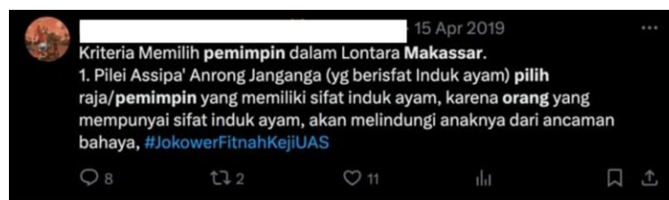
Gambar 1. Netnografi Preferensi Pemilih Makassar

Temuan ini didukung oleh penelitian berdasarkan hasil netnografi, pada platform media sosial X, dimana warga Makassar menyatakan memilih pemimpin berdasarkan nilai yang mereka yakini yaitu adalah rasa malu (siri'). Dalam konteks pemilihan presiden, @Almuiz_Zona dalam tweetnya menyebutkan bahwa warga makassar tidak memilih prabowo karena orang bugis mengenal siri', dimana prabowo tidak mencerminkan sifat tersebut ketika pemilihan presiden. Temuan ini konsisten dengan pernyataan Sjaf (2023), bahwa nilai siri telah menjadi faktor utama dalam memilih pemimpin. Selain itu, sebuah tweet dari platform X dimana mencantumkan beberapa nilai kepemimpinan berdasarkan budaya Makassar yaitu Lontara Makassar. Nilai-nilai ini menjadi kriteria ideal masyarakat Makassar dalam memilih pemimpin.