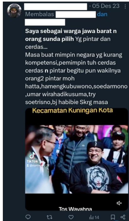
Gambar 5. Netnografi Preferensi Pemilih Sunda

akan memilih orang yang baik untuk menjadi pemimpin. Tambahnya, adalah rasis apabila memilih pemimpin berdasarkan latar belakang terutama suku, karena pemimpin yang akan dipilih bukan dipilih untuk menjadi kepala suku.