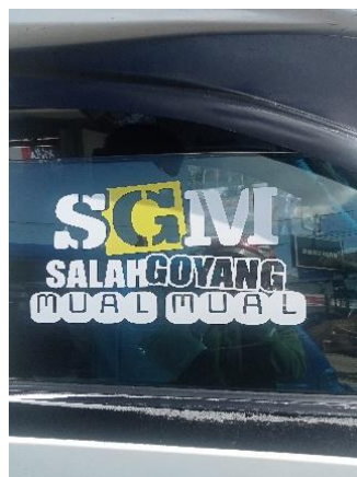
Gambar 4. SGM: Salah Goyang Mual-Mual

Pada gambar 4 menggunakan singkatan dari salah satu produk susu untuk anak-anak yakni SGM. Singkatan tersebut dikreasikan menjadi bentuk peringatan atau sindiran kepada