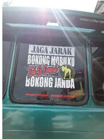
Gambar 6. Jaga Jarak Bokong Mobilku Tak Seempuk Bokong Janda

Kalimat pada gambar 6 merupakan sebuah kalimat ajakan/permohonan. Frasa Jaga Jarak dalam KBBI memiliki makna bertugas menjaga berkawal menjaga keselamatan dan keamanan. Kata jarak memiliki makna sebagai ruang atau sela (panjang/jauh) antara dua benda atau dua tempat. Dengan demikian frasa jaga jarak ditujukan untuk menjaga keselamatan diri dengan cara mengatur jarak dengan sesuatu yang lain. Sedangkan untuk pemilihan kata janda merupakan sebutan kepada perempuan yang telah menikah atau memiliki anak tanpa suami. Pemilihan frasa bokong janda secara etis tidak seharusnya dimiripkan dengan bokong mobil.