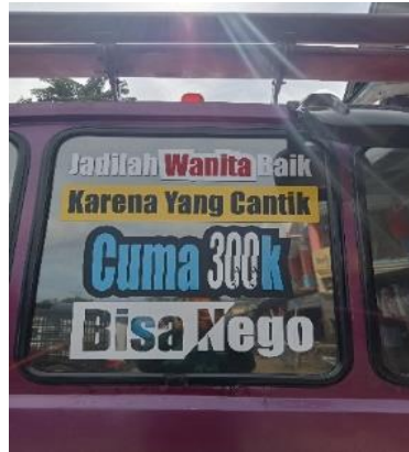
Gambar 1. Jadilah Wanita Baik Karena yang Cantik Cuma 300 K, Bisa Nego

Pada gambar 1, kalimat tersebut merupakan kalimat ajakan kepada perempuan. Bentuk kalimat ajakan dapat dilihat dari awal kalimat berupa kata ajakan " Jadilah ". Kalimat tersebut dilatari oleh sebuah alasan mendasar yang ditandai oleh kata penghubung " karena " dimana disertai dengan penjelasan angka uang, dan penawaran pada frasa " Cuma 300 K " dan " bisa di nego " yang artinya produk murahan dan bisa ditawar.