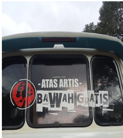
Gambar 7. Atas Artis Bawah Gratis

Pernyataan tulisan gambar 7 merujuk pada perempuan. Hal tersebut diketahui melalui kata artis . Kata " artis " menurut KBBI adalah ahli seni perempuan. Gambar 7 juga terdapat kata antonim atas dan bawah serta kata gratis yang memiliki makna tanpa bayaran. Secara keseluruhan permainan kata-kata pada gambar 7 merujuk kepada perempuan yang dalam hal ini wajah perempuan cantik, halus dan manis yang identik dengan tuntutan wajah seniwati sedangkan pada pernyataan selanjutnya bawah gratis dipertegas dengan penebalan huruf yang mana menegaskan bahwa bagian bawah perempuan gratis.