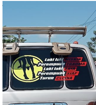
Gambar 3. Laki-Laki Miskin Perempuan Trauma Laki-Laki Kaya Perempuan Siap Turun Celana

Pada gambar 3, perempuan digambarkan sebagai sosok yang siap melakukan apa saja untuk mendapatkan uang, termasuk dengan menggadaikan kehormatan dirinya. Hal tersebut dapat dilihat dari kata antonim laki-laki dan perempuan , " miskin " dan kaya serta " trauma " dan siap turun celana . Kalimat di atas juga disertai dengan visual yang vulgar dengan maksud mempertegas pernyataan di sampingnya.