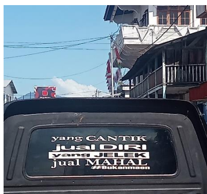
Gambar 2. yang Cantik Jual Diri, yang Jelek Jual Mahal

Pada gambar 2, terdapat pemilihan kata-kata antonim yakni kata " cantik " dan " jelek " serta " jual diri " dan " jual mahal ". Pada frasa Jual diri memiliki makna "murahan" dan pada frasa jual mahal memiliki makna "angkuh/sombong".