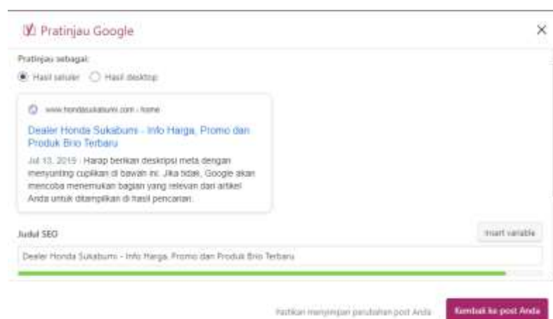
Gambar 4. Optimasi Title Tag

Berdasarkan Gambar 3, dilakukan instalasi plugin Yoast SEO untuk memudahkan dalam mengoptimalkan konten, memperbaiki struktur situs, dan mengelola elemen-elemen penting yang berkontribusi pada peringkat halaman website. Kemudian optimasi title tag memiliki peran penting dalam SEO On Page karena judul halaman adalah salah satu faktor utama yang diperhatikan oleh mesin pencari Google.