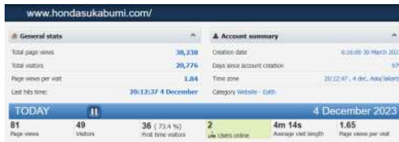
Gambar 7. Pasang Histats

Berdasarkan Gambar 7, dilakukan pemasangan histats yang memberikan informasi mengenai total tampilan halaman, total pengunjung, tampilan halaman per kunjungan dan mendapatkan wawasan yang diperlukan untuk meningkatkan performa website Honda Sukabumi. Kemudian pemasangan Google Analytics memiliki peran penting untuk mendapatkan wawasan mendalam tentang kinerja situs website.