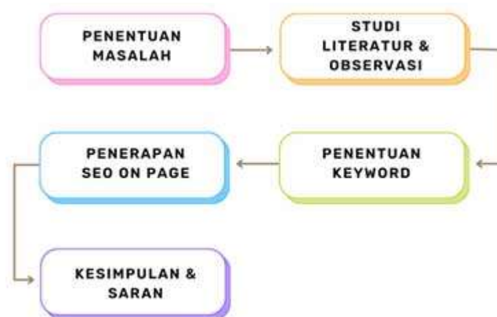
Gambar 1. Alur Penelitian

Berdasarkan pada Gambar 1, tahapan penelitian dimulai dengan mengidentifikasi masalah, kemudian melakukan studi literatur dan observasi, selanjutnya dilakukan penentuan keyword, berikutnya adalah penerapan SEO On Page, langkah akhir adalah menyusun kesimpulan dan saran.