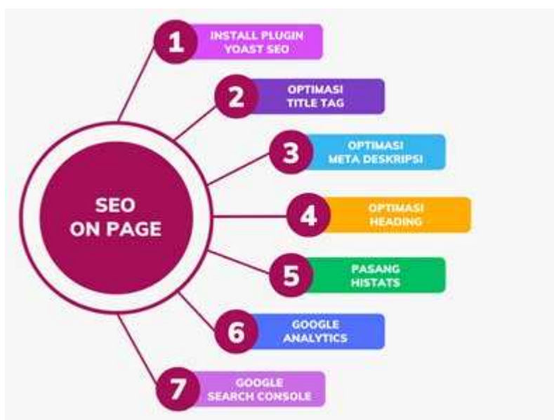
Gambar 2. Metode SEO On Page

Berdasarkan pada Gambar 2, Metode SEO On Page dimulai dengan instalasi plugin Yoast SEO, setelah itu optimasi title tag, kemudian optimasi meta deskripsi, kemudian