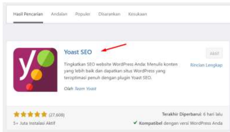
Gambar 3. Instalasi Plugin Yoast SEO

Instalasi Plugin Yoast SEO memiliki peran penting untuk mengelola dan meningkatkan website dalam mendapatkan peringkat yang lebih baik di mesin pencari.