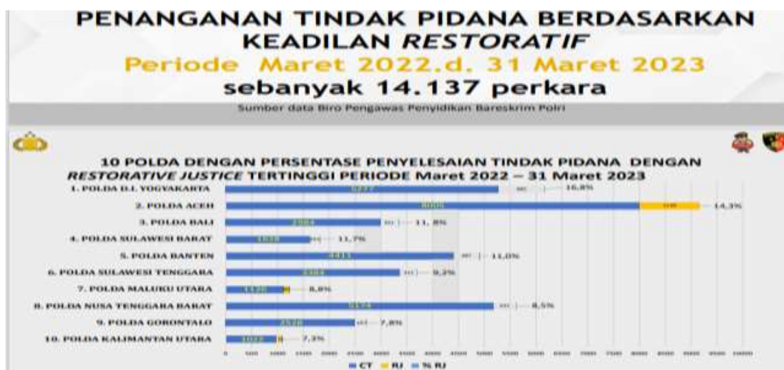
Gambar 2 Persentase Penyelesaian Tindak Pidana Dengan Restoratif Justice

Direktorat Reserse Kriminal Umum Polda Banten adalah Oragnisasi Polri yang bertugas melakukan penyelidikan dan Penyidikan Tindak pidana adapun salah satunya dengan mekanisme Peradilan Baru Restoratif Justice melalui Komunikasi Interpersonal, Komunikasi Interpersonal mempunyai penting dalam sebuah keberhasilan Restoratif justice karena adanya upaya pertemuan serta Komunikasi yg baik antar sesama memungkinkan keduanya berkomunikasi sehingga terjalinnya hubungan yg baik kembali dan upaya solusi yang semuanya melalui Komunikasi Interpersonal baik dengan Penyidik, ataupun masyarakat dengan penyidik.