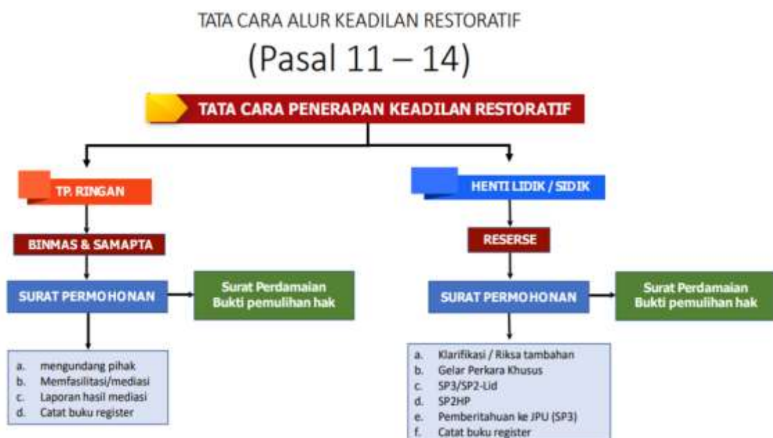
Gambar 4 Proses Tata Cara Alur Restoratif Justice

Penyelesaian masalah merupakan suatu kegiatan yang kompleks dan tingkat tinggi dari proses mental seseorang, dimana keberadaan antara dua orang atau lebih dalam melakukan mediasi secara komunikasi interpersonal. Penyelesaian masalah didefinisikan sebagai kombinasi dari gagasan yang cemerlang untuk membentuk kombinasi gagasan yang baru, ia mementingkan penalaran sebagai dasar untuk mengkombinasikan gagasan dan mengarahkan kepada penyelesaian masalah. Penyelesaian masalah mempunyai beberapa alternatif penyelesaian ( solution ). Mediasi dapat mengantarkan para pihak ketiga pada perwujudan kesepakatan damai yang permanen dan lestari, mengingat penyelesaian sengketa melalui mediasi menempatkan kedua belah pihak pada posisi yang sama, tidak ada pihak yang dimenangkan atau pihak yang dikalahkan yaitu win-win solution (Utomo, 2023). Sementara pernyataan sederhana pada umumnya memerlukan suatu penyelesaian yang pasti. Proses Penyelesaian secara rinci sebagai berikut: a) Memahami permasalahan; b) Memahami hubungan antara kenyataan dan harapan c. Merencanakan Penyelesaian masalah; d) Melaksanakan pemecahan masalah (solusi) berdasarkan rencana; e) Memeriksa kembali atau mengevaluasi hasil dari Penyelesaian masalah yang telah dilakukan (Prawoko, 2023).