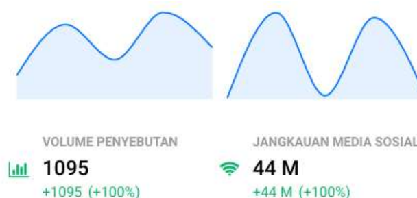
Gambar 6. Analisis Perkembangan Starbucks Pada Media Sosial X Melalui Social Media Monitoring Dalam Periode Waktu 14 Februari - 15 Maret 2024

Analisis Perkembangan Brand Starbucks pada Media Sosial X (Twitter) Melalui Social Media Monitoring