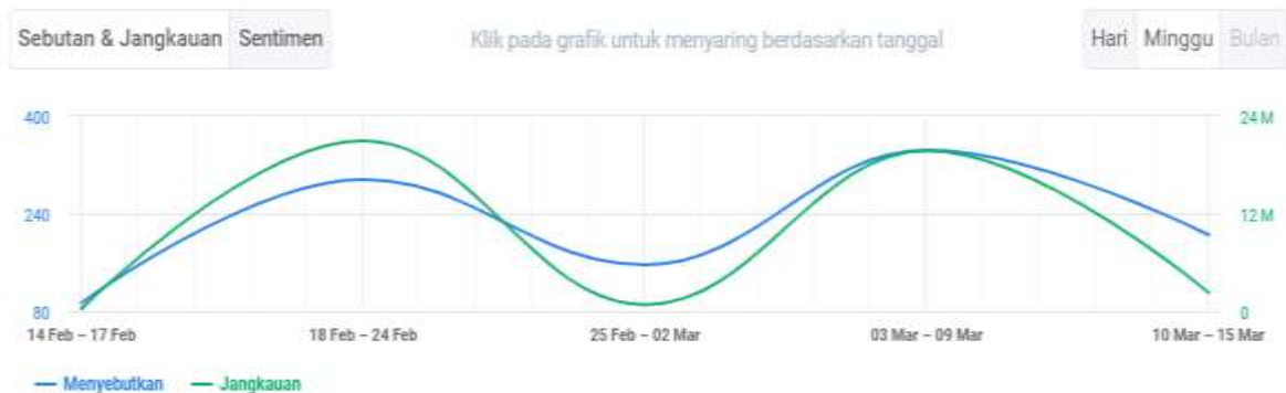
Gambar 4. Hasil Analisis Mentions dan Reach terhadap Brand Starbucks dalam Skala Mingguan Dalam Kurun Waktu 14 Februari - 15 Maret 2024

II yakni sebesar 20.957.366 terhitung sejak 18 Februari hingga 24 Februari 2024, kemudian reach terendah terdapat pada Periode I yakni sebesar 309.917 terhitung sejak 14 Februari hingga 17 Februari 2024.