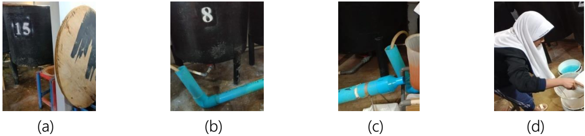
Gambar 4. Proses pemanenan Artemia sp (a) Pelepasan aerasi dan penutupan tank (b) Pemanenan melalui outlet menuju separator (c) Penyaringan Artemia sp . (d) Dipping formalin 200 ppm