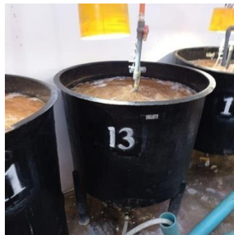
Gambar 1. Tank penetasan Artemia sp.

Wadah yang digunakan selama penelitian yaitu 2 conical tank berbentuk tabung dengan bagian bawah kerucut dengan diameter atas dan bawah masing-masing adalah 130 cm dan 100 cm, tinggi 100 cm dengan kapasitas 600L (Gambar 1). Persiapan wadah budidaya diawali dengan melakukan pencucian conical tank beserta alat-alat yang akan digunakan selama proses penetasan menggunakan detergent yang berfungsi sebagai antiseptik. Hal ini sesuai dengan Sutaman (1993), mengatakan bahwa pencucian bak dilakukan dengan detergen yang berfungsi sebagai antiseptik. Setelah proses pencucian, selanjutnya dilakukan pengeringan selama 24 jam untuk memutus siklus hidup bakteri atau bibit penyakit yang dapat berperan sebagai patogen. Pemasangan aerasi dilakukan dengan memasang pipa saluran udara yang dilengkapi dengan keran aerasi sebagai pengontrol tekanan udara yang masuk ke dalam kolam. Selanjutnya dilakukan pemasangan selang aerasi sejumlah 5 titik secara vertikal dengan dilengkapi batu aerasi sebagai pemberat dan pemecah udara. Instalasi aerasi dipasang di tengah conical tank dan dihidupkan selama 24 jam secara terus-menerus. Aerasi pada bak penetasan berfungsi untuk menyuplai oksigen di dalam air. Sementara itu pencahayaan menggunakan lampu dengan intensitas cahaya 2000 lux yang diletakkan secara menggantung di atas conical tank seperti yang dapat dilihat pada gambar 1.