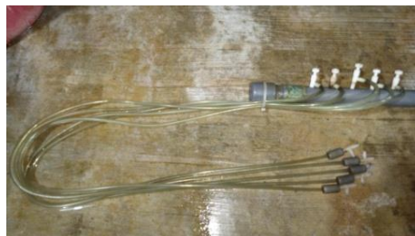
Gambar 2. Aerasi penetasan Artemia sp

Pemasangan aerasi dilakukan dengan cara mengaitkan 5 aerasi menjadi satu kemudian dipasang di titik tengah conical tank yang sudah terisi air selama 24 jam secara terus-menerus. Proses ini bertujuan untuk memastikan air yang digunakan sebagai media perkembangbiakan kista artemia steril dan meningkatkan kualitas air. Aerasi yang digunakan selama proses penetasan dapat dilihat pada gambar 2.