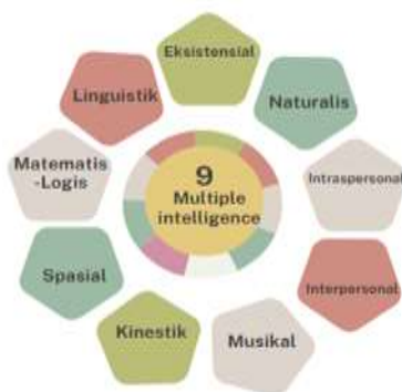
Gambar 3. Kecerdasan Majemuk oleh Howard Gardner