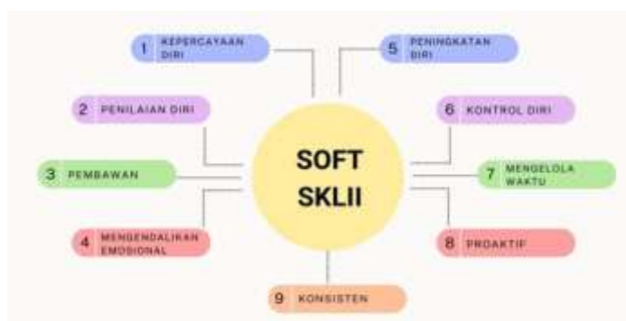
Gambar 2. Bagian-Bagian Soft Skill

Kategori soft skill yang umumnya terbagi menjadi dua, yaitu kemampuan interpersonal dan intrapersonal, yang melibatkan kemampuan mengatur diri sendiri. Dengan kata lain, secara ringkas mencakup (Suardipa 2021:66):