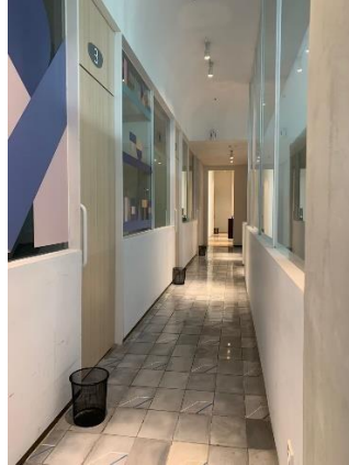
Gambar 3. Koridor Co-working