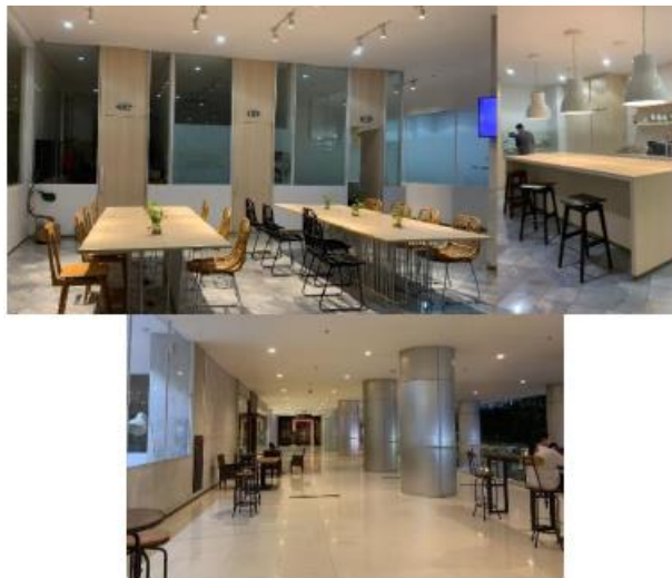
Gambar 4. Ruang dalam Co-working Space