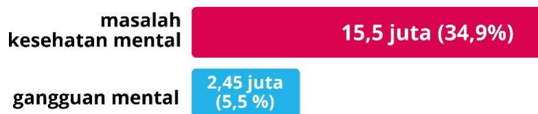
Diagram 1. Data Remaja di Indonesia Yang Mengalami Masalah Kesehatan Mental & Gangguan Mental Tahun 2022

Dilansir dari Indonesia National Adolescent Mental Health Survey (2022), sebanyak 15,5 juta (34,9%) remaja di Indonesia mengalami masalah kesehatan mental dan 2,45 juta (5,5%) remaja di Indonesia mengalami gangguan mental (lihat Gambar 1). Remaja kelahiran tahun 1997—2012 atau akrab disebut Gen Z merupakan generasi yang memiliki kecenderungan permasalahan kesehatan mental dari generasi lain, mereka berjuang mencari kesejahteraan psikologi ini disebabkan karena generasi ini mengalami tekanan hampir dua kali lipat dibanding generasi tua (Jauhari & Ariviani, 2023).