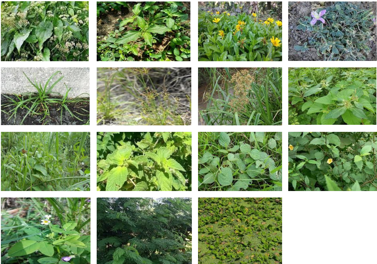
Tabel 2. Dokumentasi Jenis Tumbuhan Asing Invasif di Desa Wisata Nganggring